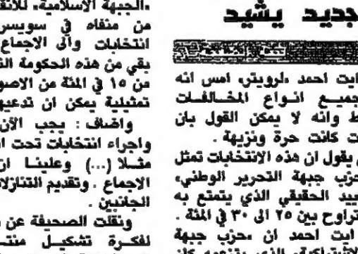
مجلسه مرور اربعين يوما على استشهاده

مجلسه مرور اربعين يوما على استشهاده. استشهاده الماسوف على شبهه النقيب في الجيش.